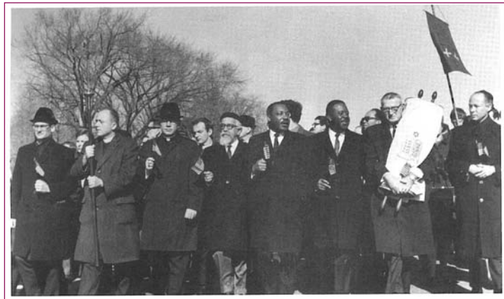
Heschel con Martin Luther King, in marcia a Arlington, Virginia, 1968

Il convegno è dedicato alla figura e all'opera di uno dei più importanti esponenti del pensiero ebraico del Novecento, Abraham Joshua Heschel (Varsavia 1907–New York 1972), di cui quest'anno si celebra il centenario della nascita. Di origini polacche e tradizione familiare rabbinica e chassidica, Heschel studiò a Vilna e a Berlino e fu successore di Martin Buber alla direzione della scuola ebraica di Francoforte, prima di trasferirsi a Londra e poi definitivamente negli Stati Uniti, ove visse dal 1940 fino alla morte, insegnando Mistica Ebraica al Jewish Theological Seminary di New York. Poeta, saggista e filosofo della religione di notevole fascino e impeto profetico, Heschel sentì l'urgenza di un insegnamento che, pur radicato nella tradizione e attingendo alle fonti antiche, sapesse parlare al mondo moderno e ascoltarne gli interrogativi. Uomo del dialogo, fu attivo nelle relazioni ebraico-cristiane e nei movimenti di protesta contro la guerra e per i diritti civili a fianco di Martin Luther King. Fu autore di molti libri, scritti con efficacia espressiva in varie lingue, principalmente in inglese, ma anche in ebraico, yiddish e tedesco. La sua opera è stata tradotta in Italia per iniziativa di Elémire Zolla a partire dagli anni '60 ed è ancora oggi ampiamente presente nell'editoria nazionale, oltre che in America, Europa, Israele e altre parti del mondo.